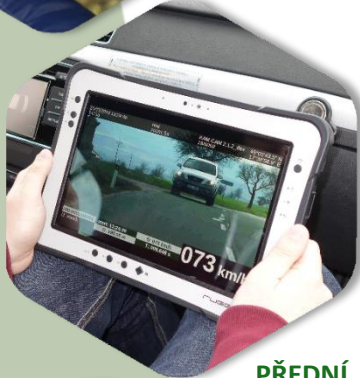
PŘEDNÍ OVLÁDACÍ PANEL